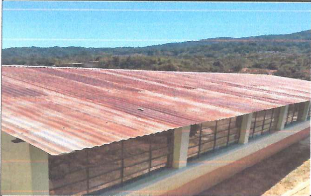
Mejoramiento de techo de aula