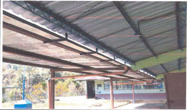
Mejoramiento de canales