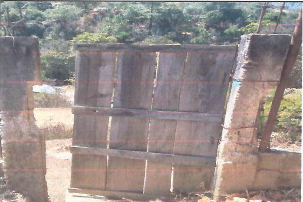
Mejoramiento de portón