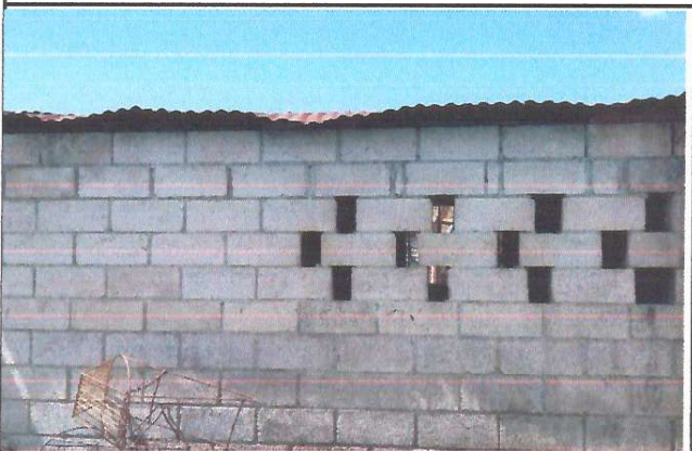
Mejoramiento de techo de cocina

Observación: Si es necesario se pueden agregar hojas adicionales y actualizar el número de hojas.